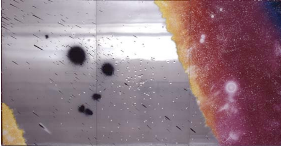
Jacques Monory Ciel n°29, Ciel et mur de métal avec la galaxie NGC. 1199 et galaxie d'accompagnement. Ref. 609 1979 Peinture sur métal avec impacts de balles. 195x380 cm.