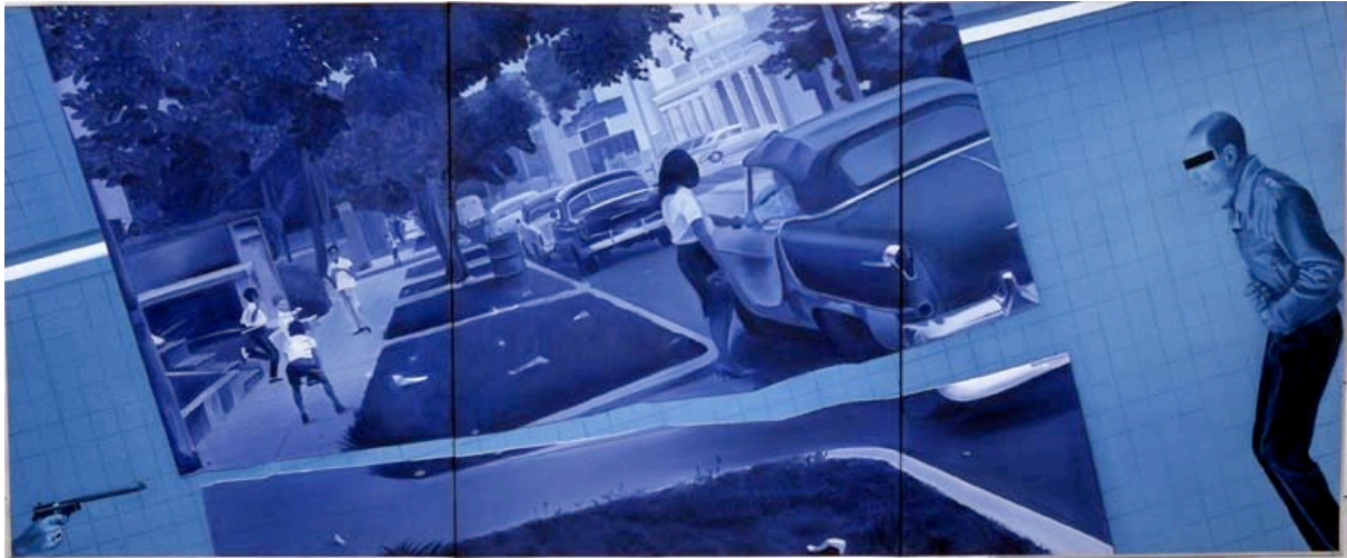
Jacques Monory Meurtre n°1, ref. 301 1968 Huile sur toile 150x390 cm.