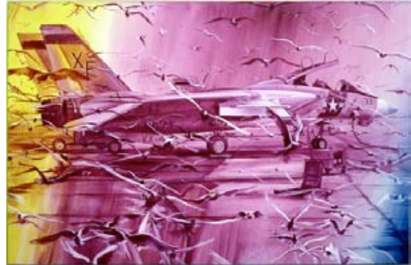
Jacques Monory Toxique n° 3, Fragile, ref. 636 1982 Huile sur toile 150x230 cm.