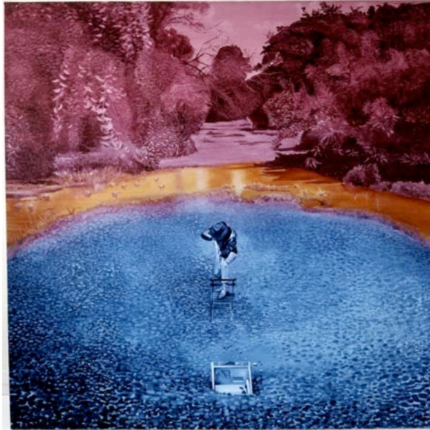
Jacques Monory Technicolor n°1, "Monet est mort". ref. 543 1977 Huile sur toile 150x150 cm.