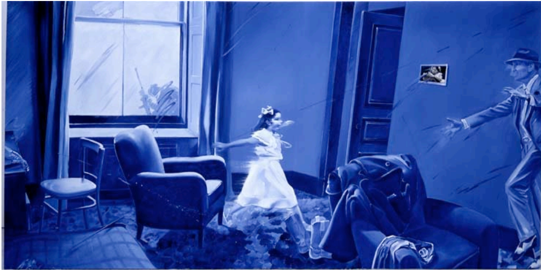
Jacques Monory la Voleuse n° 9, ref. 708 1986 Huile sur toile et photo 170x340 cm.