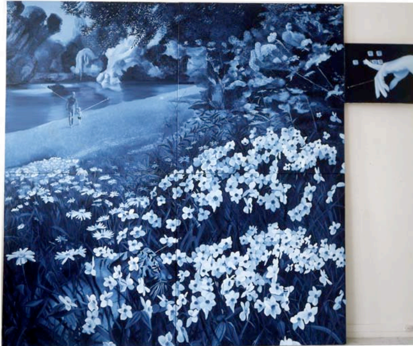
Jacques Monory Velvet Jungle n° 13/1, ref. 391/1 1971 Huile sur toile 260x300 cm. Collection Musée d'Art Moderne de la ville de Paris.