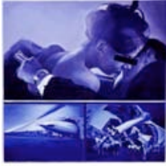
Philippe Piguet Baiser, 2000 50 x 50 cm