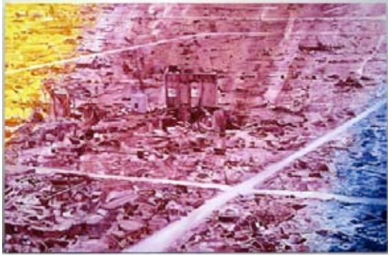
Jacques Monory Toxique n° 2, Hiroshima, ref. 635 1982 Huile sur toile 150x230 cm.