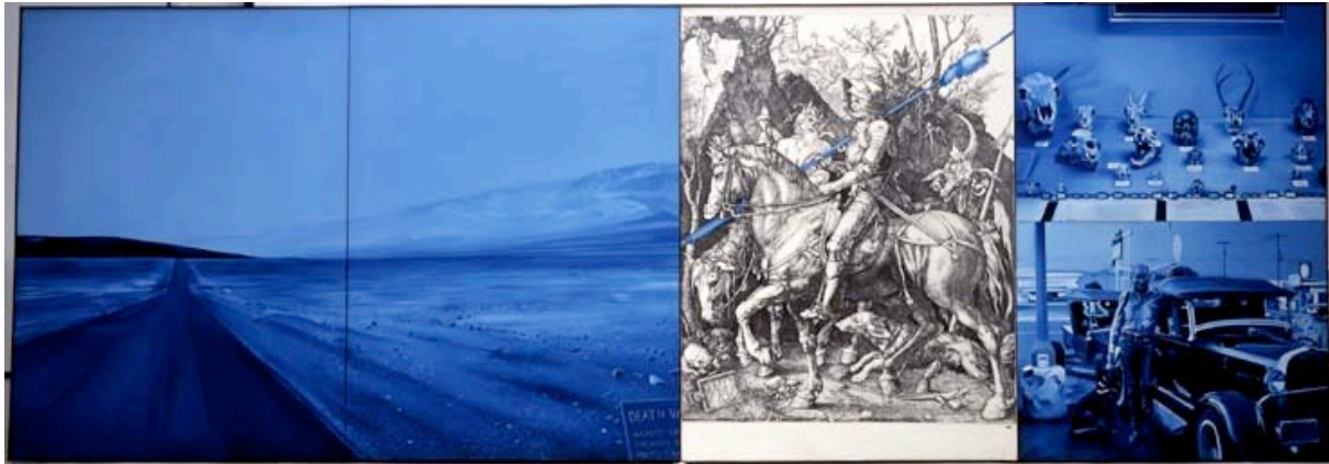
Jacques Monory Death Valley n°1, ref. 489 1974 Huile sur toile et toile sensibilisée, 170x490 cm.