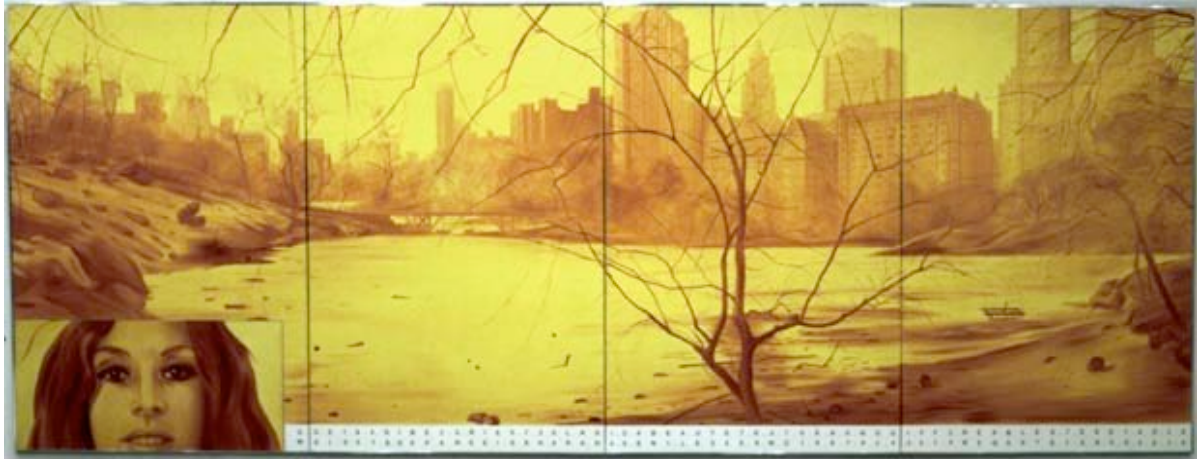
Jacques Monory N.Y. n°10, ref. 383 1971 Huile sur toile 195x456 cm.