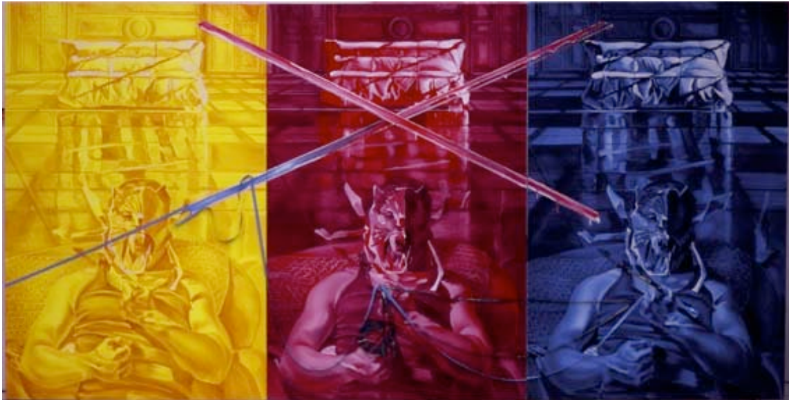
Jacques Monory Alptraum n° 3 (métacime n° 4), ref. 765 1987 Huile sur toile et amorce de film bleu 230x450 cm.