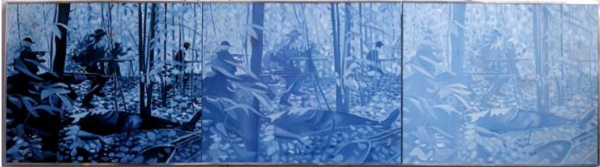
Jacques Monory Velvet Jungle n° 3/1, ref. 335 1969 Huile sur toile 60x219 cm.