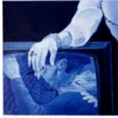
Philippe Piguet Baiser, 2000 50 x 50 cm