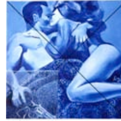
Philippe Piguet Baiser, 2000 50 x 50 cm