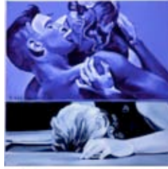
Philippe Piguet Baiser, 2000 50 x 50 cm